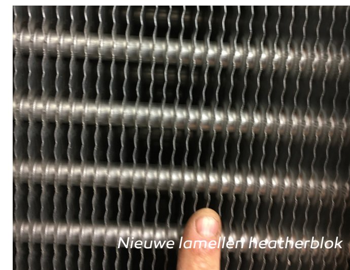
Nieuwe lamellen heatherblok